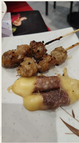
Brochettes de Bœuf